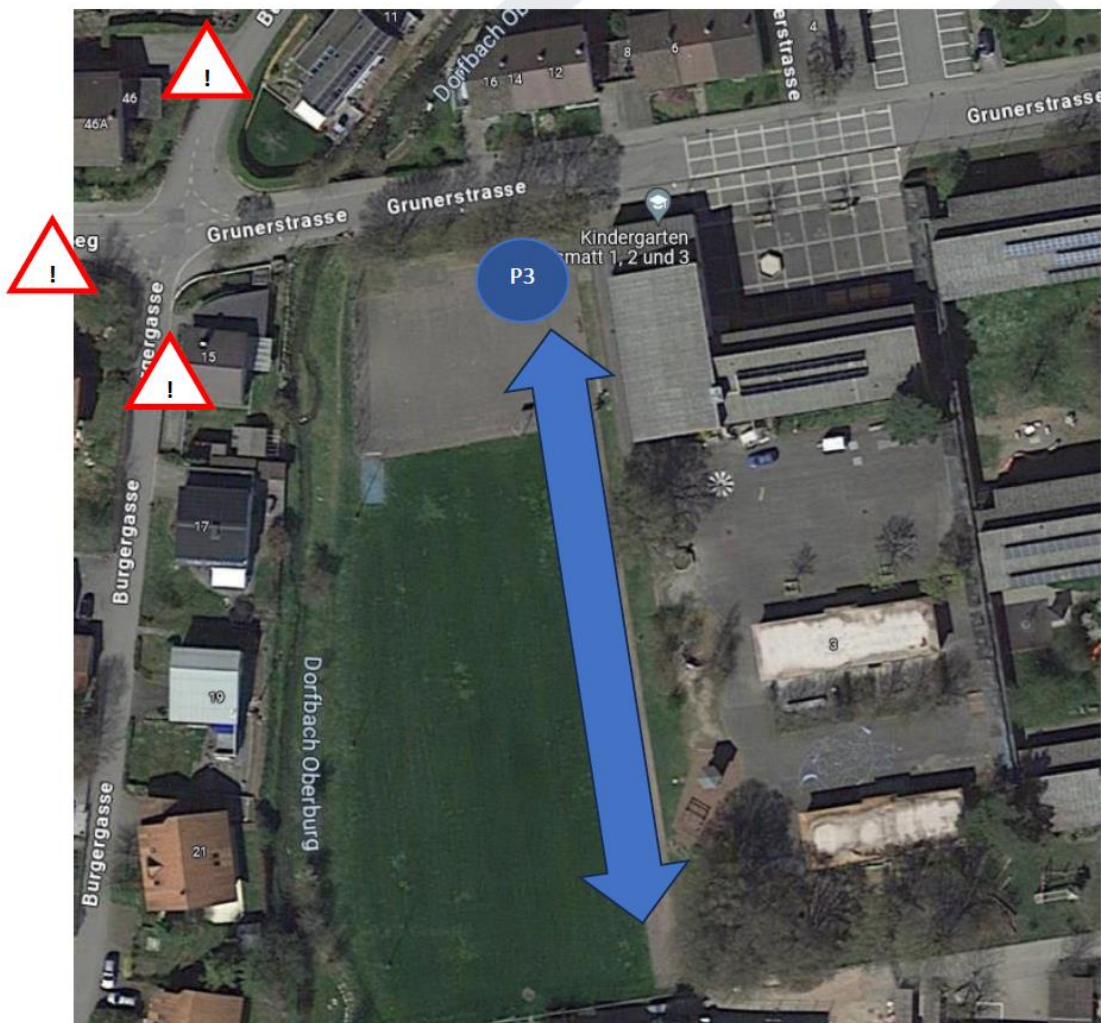
Grafik: Forrer Safety & Security Services